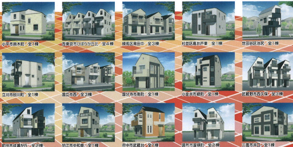
小平市鈴木町 全1棟